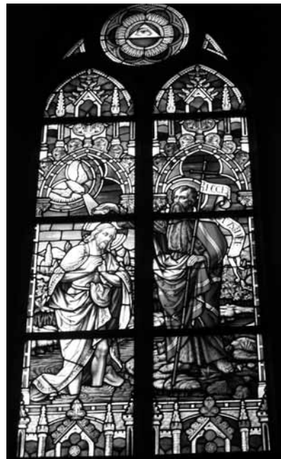
Die Taufe Jesu – Fenster in der Kirche St. Johannes Bapt. in Serkenrode