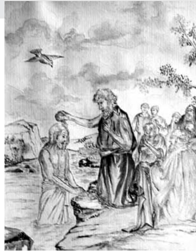
Die Taufe Jesu - Bild: Ulrich Hilber, Fretter

Im Namen des Pastoralteams wünsche ich Ihnen einen gesegneten Sonntag, Ihr Pfarrer Raimund Kinold