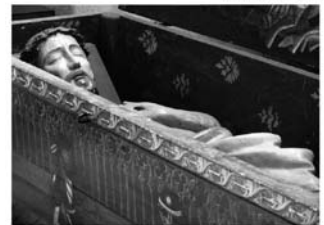
St. Marien, Erfurt

Gott ist von allem, was wir sind, wir ewig Anfangende, der verletzte Schluss, das offene Ende, durch das wir denken und atmen können.