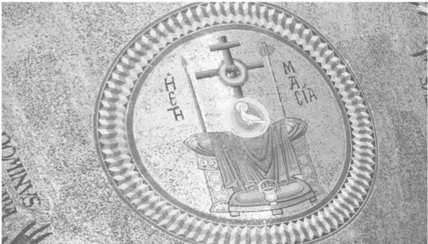
Kathedrale von Monreale

D er leere Thron Christi, das Kreuz, das die unsichtbare Anwesenheit Christi symbolisiert und die Taube sind in ihrer Einheit eine frühchristliche, byzantinische Dreifaltigkeitsdarstellung, die Etimasia (Synonym für Thron Gottes) heißt. Der leere Thron hat dabei zugleich eine zweite Bedeutung: Symbolisiert er einerseits Gottvater, deutet er andererseits die Thronbereitung für die Wiederkehr Christi und das Weltgericht an. Das Erlösungshandeln Gottes, das mit der Schöpfung durch den Vater begonnen hat, wird nach Kreuz und Tod, nach Ostern und Pfingsten in der Wiederkunft Christi vollendet.