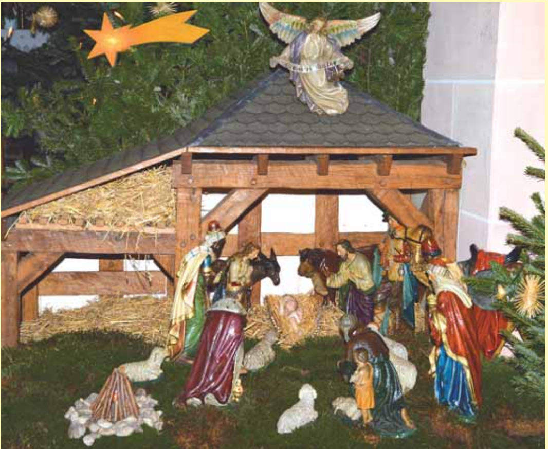
Krippe in Rönkhausen