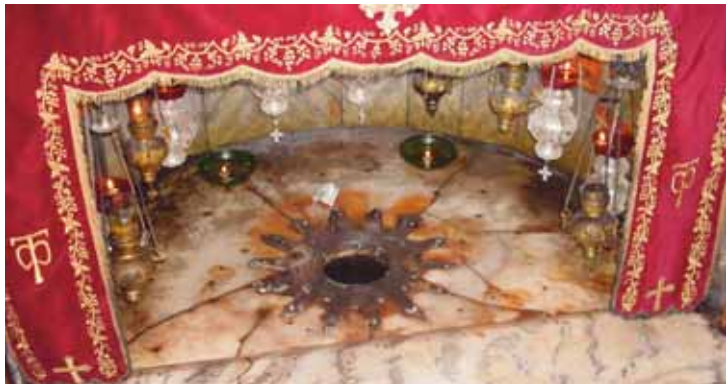
Geburtsgrotte in Betlehem